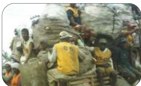
Catadores aglomerados em carro, após coleta.