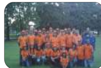
Instrutores e Monitores do RADA.

Dia 08 de Agosto, O Processo APELL estará no Ciep 032 Cora Coralina (abrigo do APELL) juntamente com a comunidade arborizando 200 mudas de árvores doadas pela REDUC.