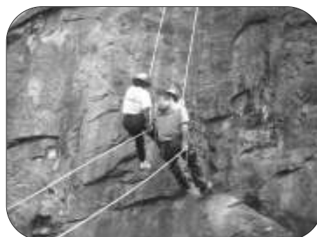
Voluntários descendo de Rapel em pedra de Fragoso.